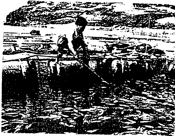
그림 3 기름으로 덮힌 양식장

시프린스호로 인한 피해는 어민들에 따르면 전남지역이 5백80억원, 경남은 1백25억원 등 모두 7백5억원으로 집계됐다.