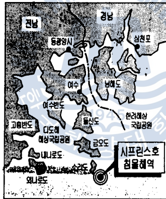
그림 2 침몰 해역

선장은 태풍이 오른쪽으로 돌기 때문에 섬이 많더라도 바람을 덜 받는 서쪽으로 피해야 한다는 생각으로 먼바다로 피하지 않고 섬이 많은 연안으로 항해했다. 시계 제로인 상태에서 평소 항해하던 작도와 소리도 끝단 연안 항로를 따라 8노트의 속도로 피항했다. 그러다 태풍의 힘에 쏠려 배가 오후 1시20분경 섬쪽으로 밀려났기 때문에 항로를 1백80도 변경, 왼쪽으로 뱃머리를 돌렸으나 파도를 받게 됐다. 배가 전방으로 진행하지 않고 오른쪽으로 밀리면서 오후2시경 남면 소리도 동단 수중암초에 선미 기관실 바닥이 충돌, 엔진이 파손됐다(그림 2 참조).